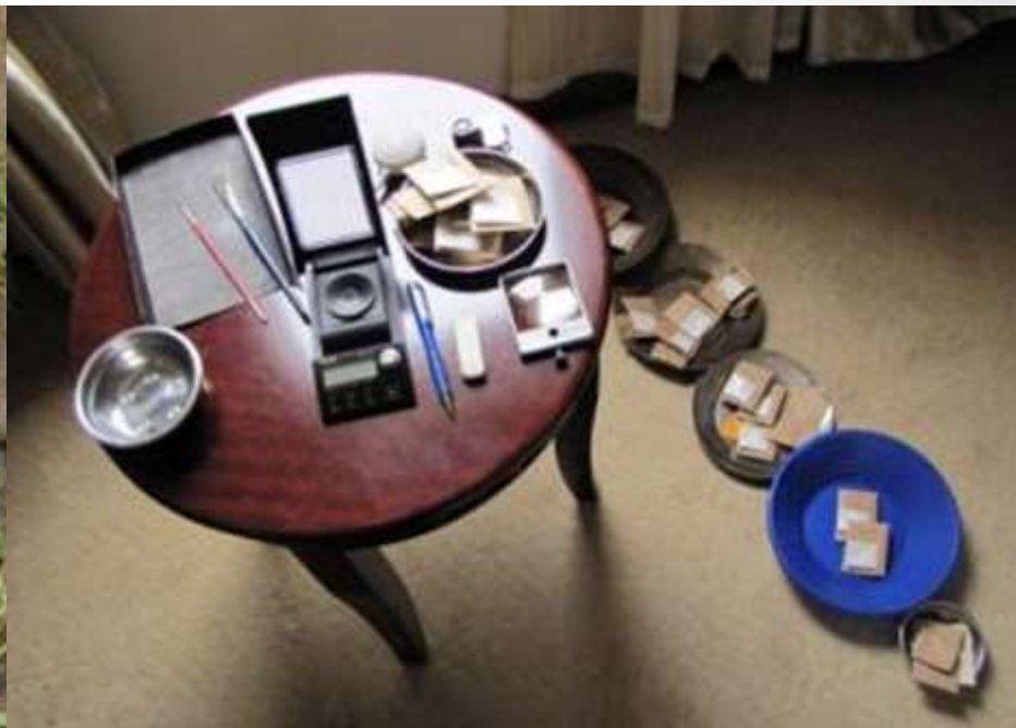
Промывка песков, обработка шлихов и взвешивание золота в гостиничных условиях