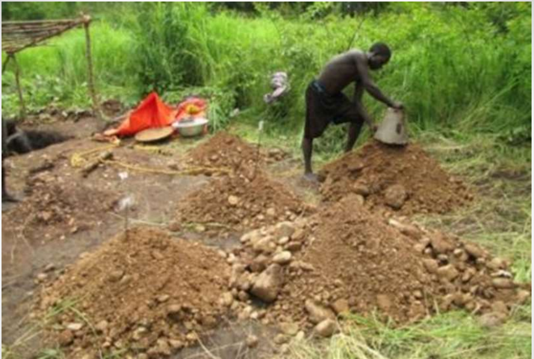
Выкладка материала проходок с отделением валунов