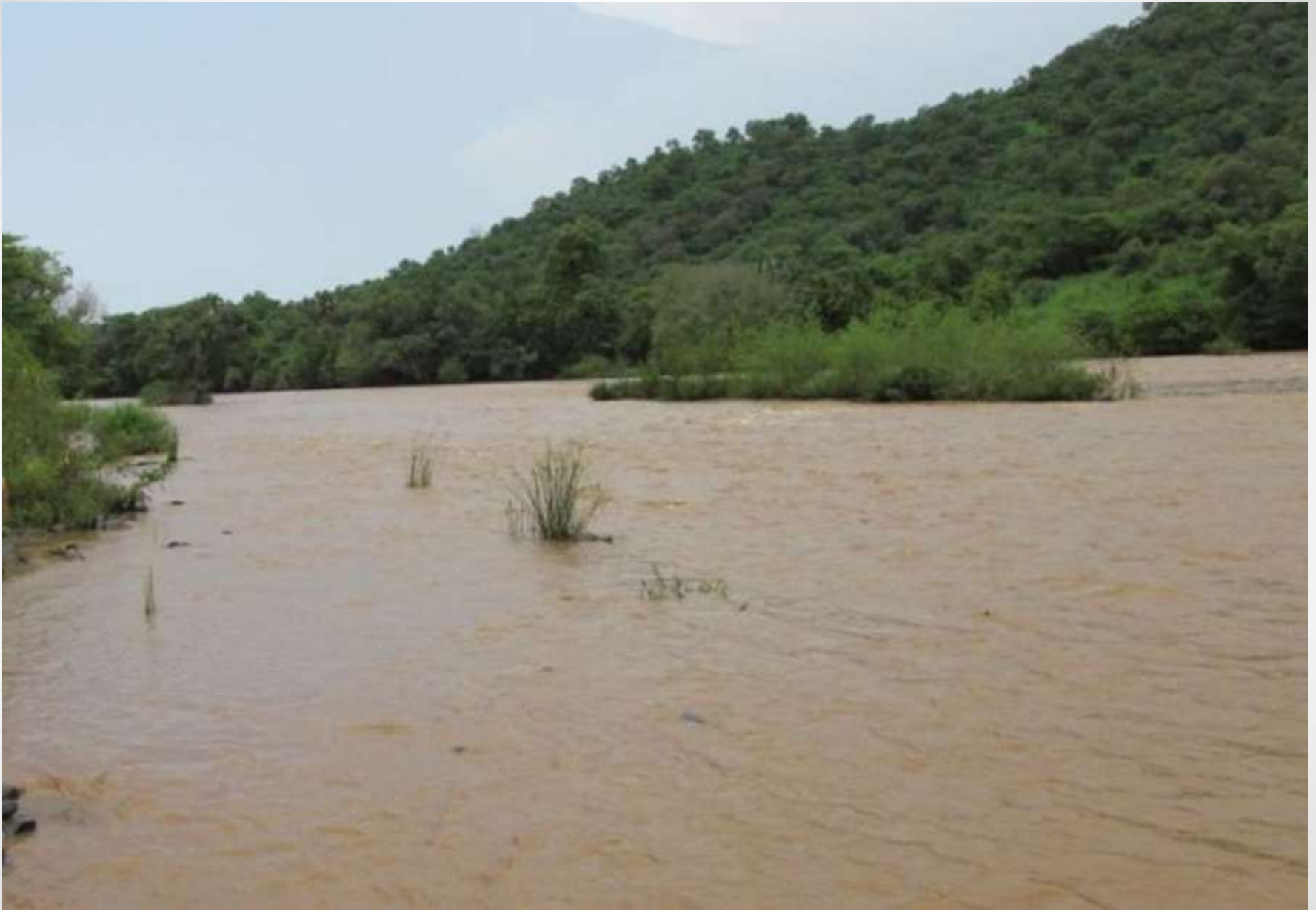
Река Белес. Вид вверх по течению.