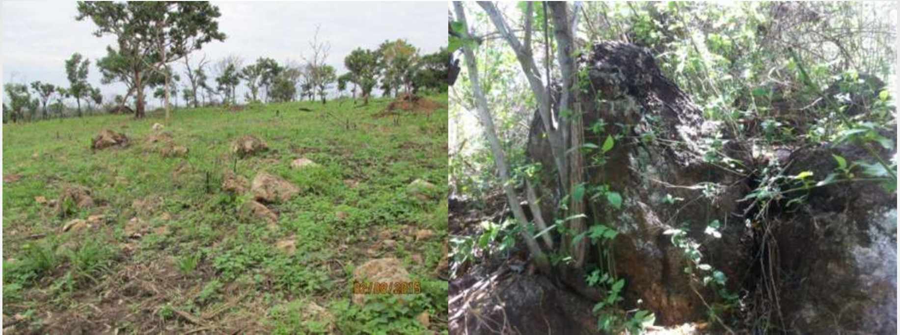
Выходы кварцевой жилы (слева) и свалы бурого железняка (справа)