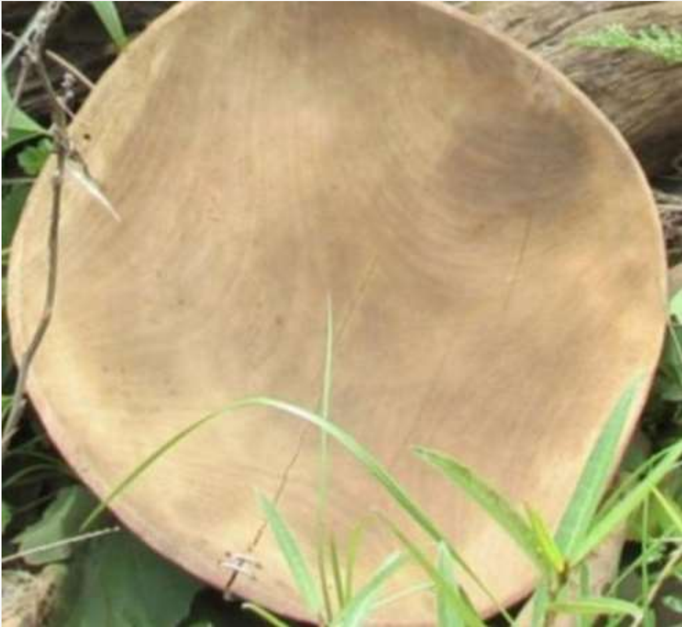
● Лоток с трещиной, использованный при обработке проб ●