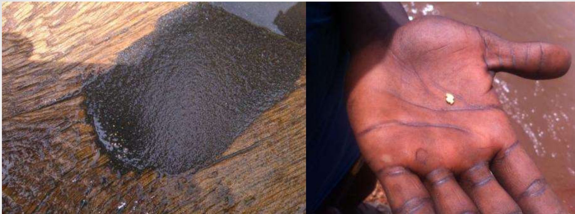
Чёрный шлик и крупное золото